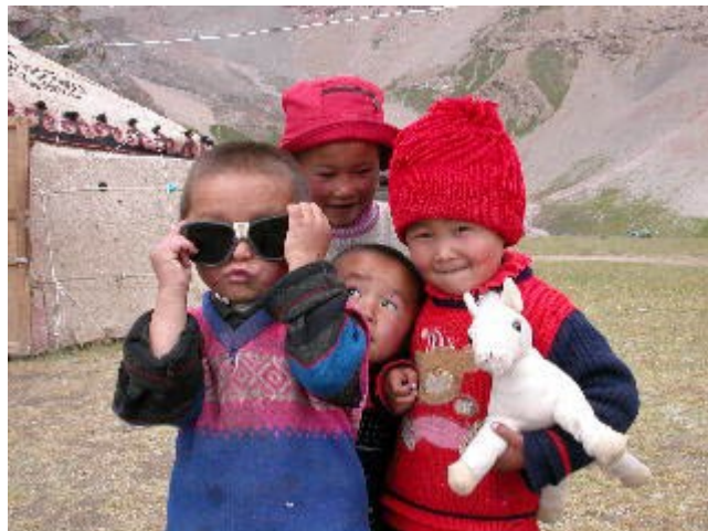
Nens del Kyrgyzstan

El pic Lenin de 7.134 metres d'alçada, està situat a l'Àsia Central, a la frontera entre Kyrgyzstan i Tajikistan. A l'est d'aquest països trobem la Xina, i al Sud-Oest, l'Afganistan. Es el segon pic més elevat del Pamir, nom que en persa "Pai-nir" vol dir "el peu del pic muntanyenc".