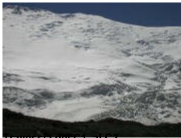
Travessia del C1 al C2

girant cap a la dreta , passant per zones d'alt risc d'allaus, fins arribar al Camp 2 ( C2 ) situat a 5.300 mts. (8-10 hores). En els dies de sol s'arriben a temperatures molt elevades, és per això, que es coneix aquest lloc com a "La Paella".