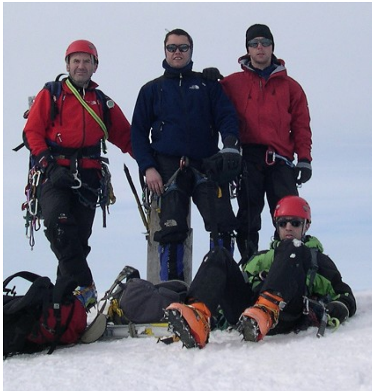
Posets (3.375 mts.) Ascensió hivernal per la Canal Jean Arlau.