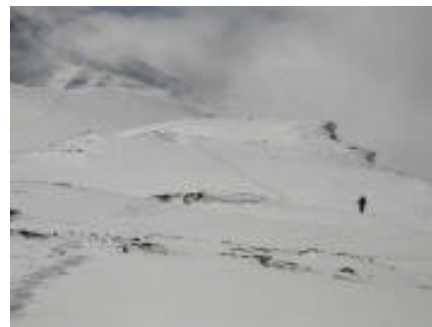
Cresta Pic Lenin.

Descens: Per descendir fins al Camp Base, farem servir la mateixa ruta que la d'ascensió. Després de fer cim, s'arribarà al Camp 3, on després d'un merescut descans, a l'endemà, s'iniciarà el descens al Camp Base, amb una durada estimada de tot un dia.