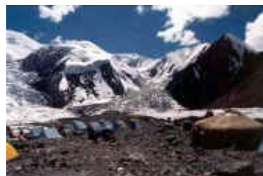
Camp 1 a 4.200 metres.

Camp 2 (5.300 mts.): Des del C1 pujarem una pendent de neu i glaç fins a 4.850 mts., amb una dificultat tècnica afegida, la presència d'esquerdes. La ruta gradualment va